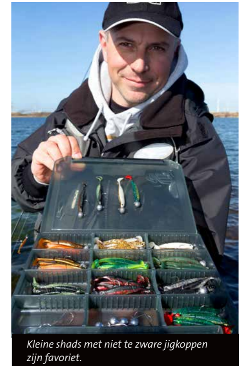
Kleine shads met niet te zware jigkoppen zijn favoriet.

Een soort van 'trollen' zou je kunnen zeggen, maar dan net even iets anders. De snelheid is verschillend en hangt van het aasgedrag van de vis af. Traag als de vis niet heel erg actief is en zich niet makkelijk laat verleiden of het water koud is, en iets sneller met fellere tikken zodra de aanbeten agressiever worden.